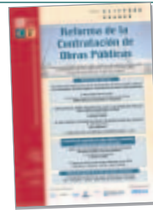
Reforma de la Contratación de Obras Públicas Madrid, 1 de junio de 2006