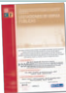
Licitación de Obras Públicas Madrid, 13 y 14 de noviembre de 2003

La reforma de la Contratación de Obras Públicas. Madrid, 17 y 18 de noviembre de 2004